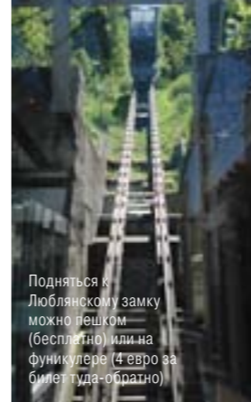
Подняться к Люблянскому замку можно пешком (бесплатно) или на фуникулере (4 евро за билет туда-обратно)