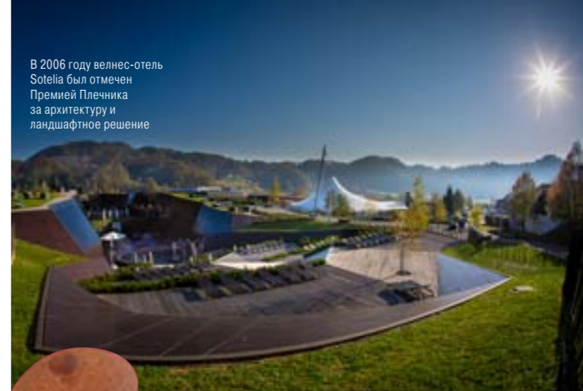
В 2006 году велнес-отель Sotelia был отмечен Премией Плечника за архитектуру и ландшафтное решение

Начнем издалека: оказывается, в Европе орудует комиссия, которая ежегодно выбирает самую красивую деревню. В 2009 году этого звания удостоилась Олимья – крохотное поселение в двух километрах от курорта, которое лег-