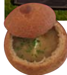
В родство славян веришь с новой силой, когда узнаешь, что словенцы не меньше русских любят ходить по грибы – для супа