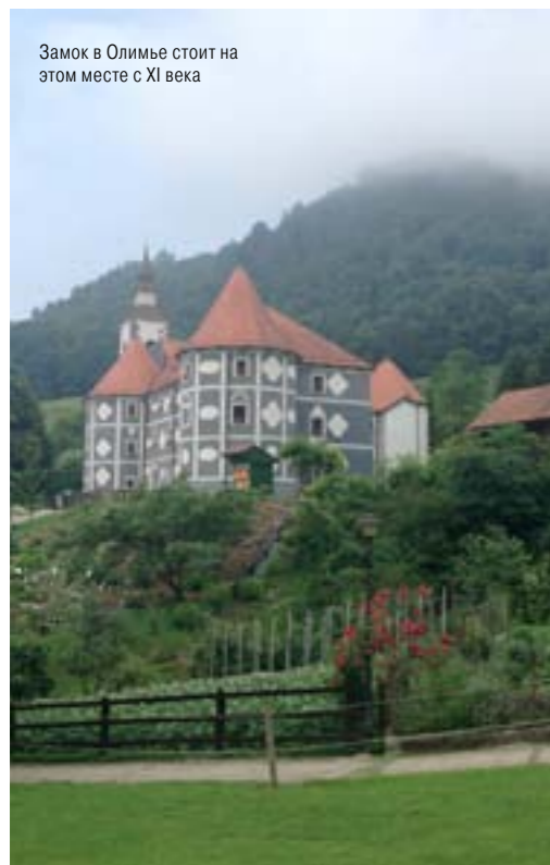
Замок в Олимье стоит на этом месте с XI века

В том, что тепленькая H 2 O, набравшаяся по пути к поверхности микроэлементов, благотворно влияет на организмы, люди уверились давным-давно. Но у словенского источника Terme Olimia есть жирный плюс: его вода, в отличие от многих других природных, полезна всем без исключения: юным, пожилым, здоровым и не очень, желающим преобразиться или просто освежить цвет лица.